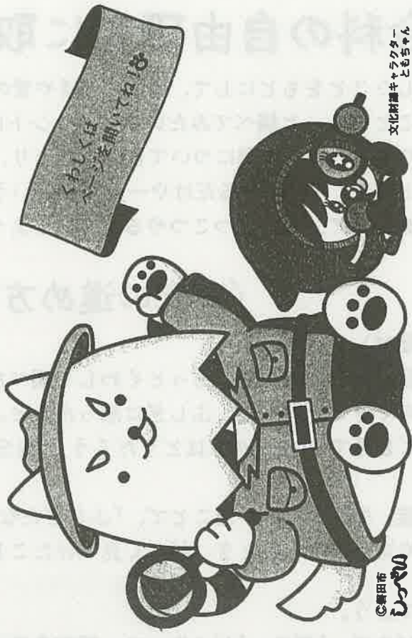
文化財課キャラクター とちちゃん

問い合わせ 〒438-0086 磐田市見付3678番地1 磐田市文化財課(磐田市埋蔵文化財センター内) 電話 0538-32-9699